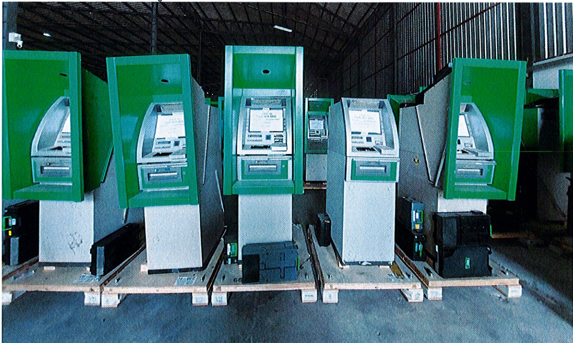
รูปถ่ายทรัพย์สินขายทอดตลาด (ATM) (บางส่วน)